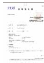
▲試験報告書 (第三者機関において立証されています。)